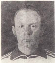
ме заслужил треньор на СССР ВАЛЕРИ ЛОБАНОВСКИ

Под негово ръководство динамовци дълго време бяха хегемони в шампионата на СССР, особено силни бяха на европейската арена, на която спечелиха Купата на купите.